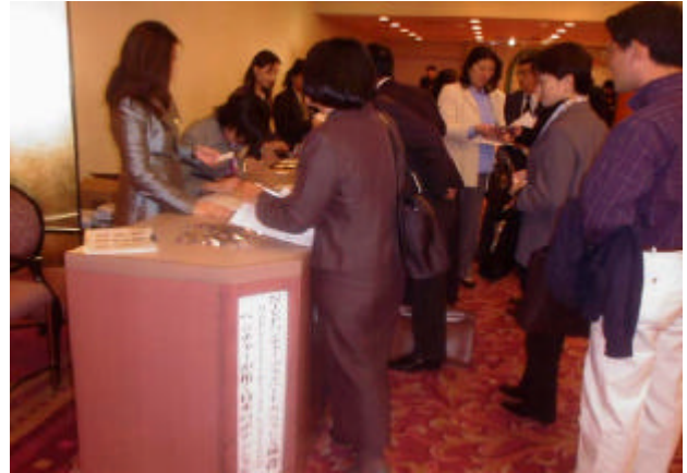
起業家、アナリストやファンドマネージャー、ジャーナリストらで賑わう会場入口