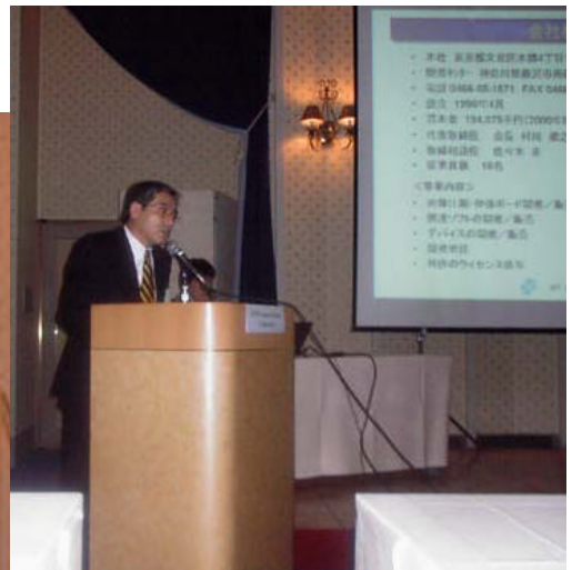
アイ・アンド・エフ宮崎社長