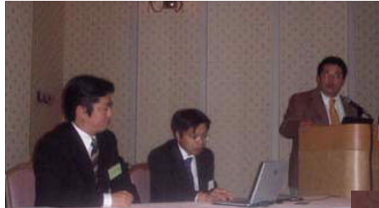
左: イチレイヨン (左から岡田社長、増沢取締役、水野会長)